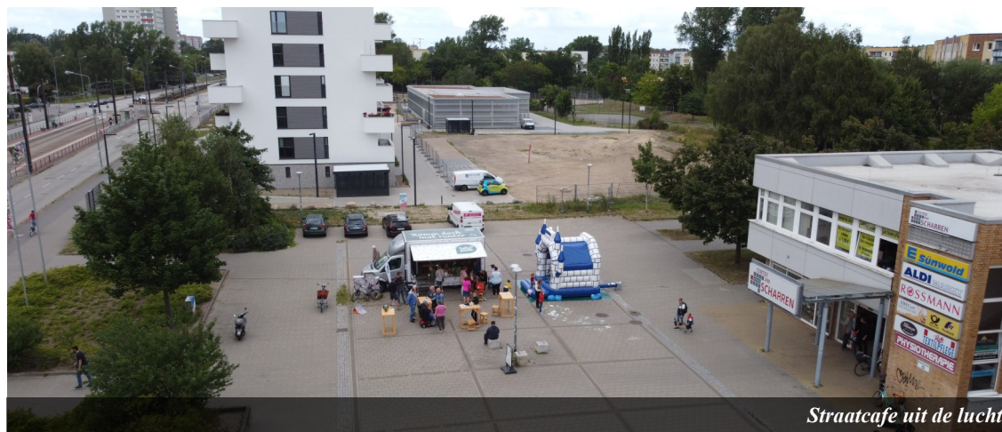
Streetcafe uit de lucht