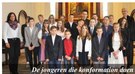
De jongeren die konfirmation doen