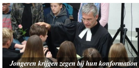
Jongeren krijgen zegen bij hun konfirmation