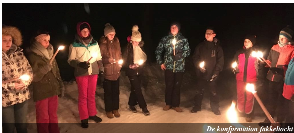
De konfirmation fakkeltocht