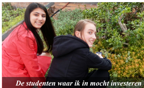
De studenten waar ik in mocht investeren