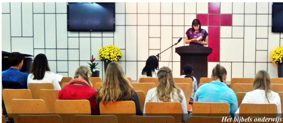
Het bijbels onderwijs