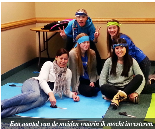
Een aantal van de meiden waarin ik mocht investeren.

Als iemand heel weinig van de Bijbel kent, zal ik hem niet gaan vertellen hoe hij de Bijbel aan anderen kan uitleggen. Ik zal beginnen om de Bijbel uit te leggen vanaf het begin! Iemand die nog nooit auto heeft gereden laat je ook niet direct op de snelweg racen. Hij zal eerst leren hoe een auto werkt en wat de verkeersregels zijn, om vervolgens het geleerde in een eerste rijles op een verlaten parkeerplaats te oefenen.