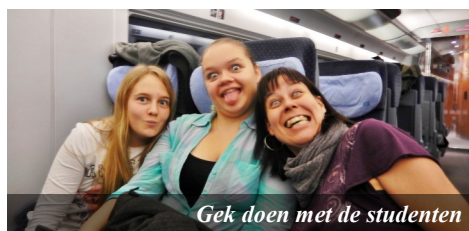
Gek doen met de studenten