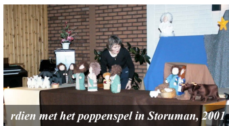
rdien met het poppenspel in Storuman, 2001