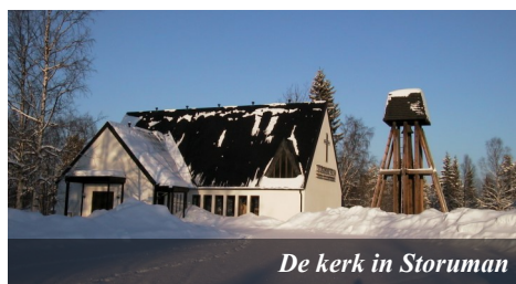
De kerk in Storuman