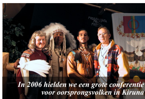
In 2006 hielden we een grote conferentie voor oorsprongsvolken in Kiruna

ANBI Aanpakker Niet-Besluitende Instelling