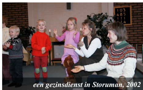
een gezinsdienst in Storuman, 2002