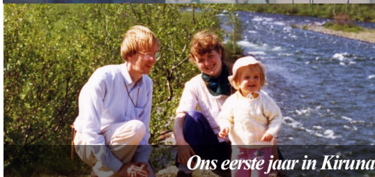
Ons eerste jaar in Kiruna

Zelf verhuisden we in 1993, inmiddels met twee kinderen, naar Storuman in zuidelijk Lapland. Daar kregen we de zorg voor vijf gemeentes. We begonnen ook een theologische opleiding en in 1996 werden we beiden geordineerd als pastoren. We bleven elf jaar in Storuman. De gemeente bestond vooral uit ouderen toen we kwamen. In onze tijd kwamen er nieuwe mensen bij en konden we ook jeugdwerk opzetten. Dat was er in geen jaren geweest. Na verloop van tijd hadden we kinderen uit de meeste klassen van de dorpschool in ons jeugdwerk. We initieerden ook een samenwerking tussen de verschillende kerken in het dorp, voornamelijk in evangelisatiewerk. Van de andere vier gemeentes zijn er inmiddels twee gesloten, vooral omdat de dorpen daar ontvolkt zijn. De gemeente in Gunnarn is klein maar nog actief. In Storuman is nu voor 50 procent een pastor. Na ons vertrek zijn er ook weer nieuwe mensen bijgekomen. We zien dat een gemeente die twintig jaar geleden heel zwak was tot zegen is geworden voor heel veel mensen in het dorp.