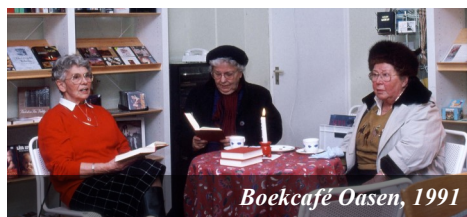
Boekcafé Oasen, 1991

De secularisatie is erg sterk. Maar er is ook een honger naar iets meer dan het materiële.