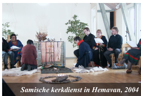
Samische kerkdienst in Hemavan, 2004