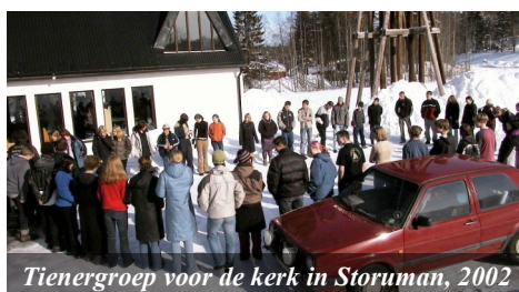
Tiengroep voor de kerk in Storuman, 2002