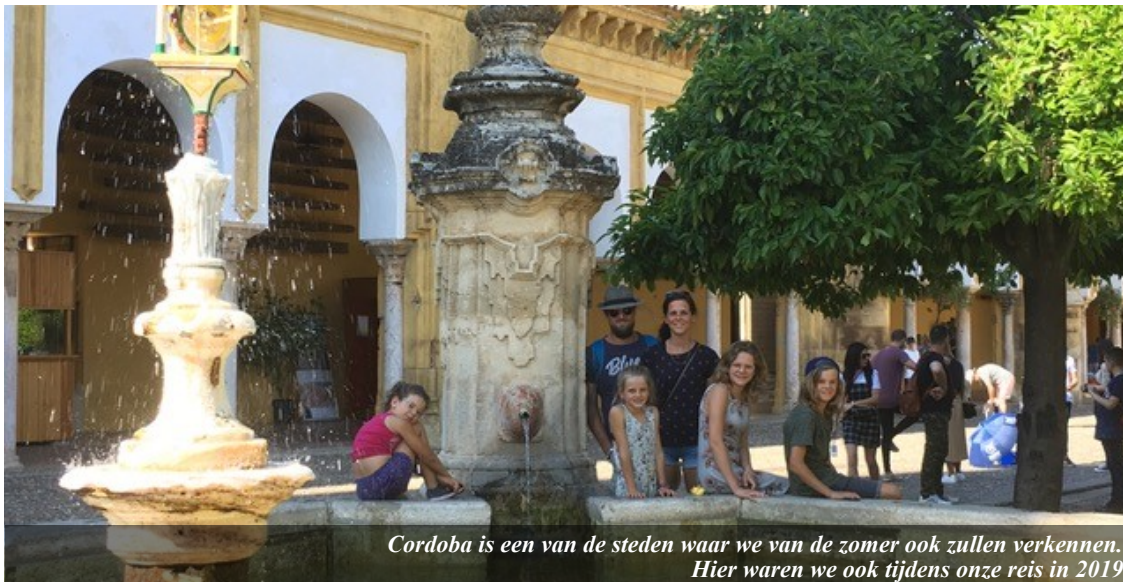
Cordoba is een van de steden waar we van de zomer ook zullen verkennen. Hier waren we ook tijdens onze reis in 2019

Vanuit InToMission worden we ‘getraind’; bijna alle meetings lopen op dit moment online via Zoom. In deze meetings werken we aan ons persoonlijk missieplan en het visieplan voor onze bediening. Op het veld hopen we straks baat te hebben bij deze zorgvuldig doorgeworstelde transitiefase, want dat is waar we nu al meer dan twee jaar inzitten. Maar de hele nieuwe toekomst krijgt steeds meer vorm, we komen dichterbij! Die toekomst kenmerkt zich door veel onzekerheden en stappen zetten in het onbekende en soms gaan we gewoon door moeilijke momenten heen. Echter, in dit alles weten we ons gedragen door de tekst van Opwekking 377: “Wat de toekomst brenge