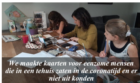
We maakte kaarten voor eenzame mensen die in een tehuis zaten in de coronatijd en er niet uit konden