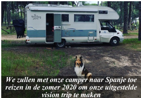
We zullen met onze camper naar Spanje toe reizen in de zomer 2020 om onze uitgestelde vision trip te maken

Er zijn ideeën ontstaan voor een missiehuis in Spanje. Ons verlangen om mensen te ontvangen zou mooi passen op een locatie waar ruimte is voor meerdere personen. Een plek waar we zelf als gezin kunnen verblijven en de