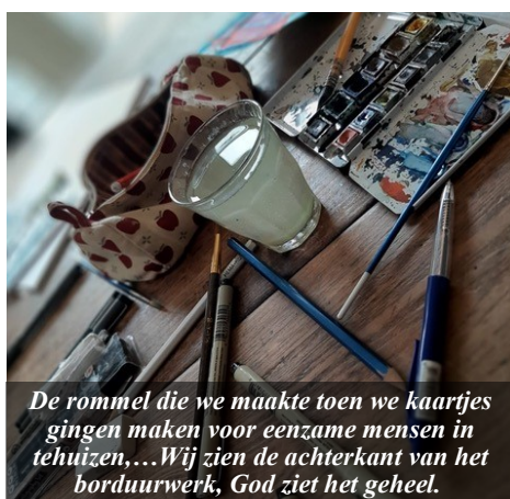
De rommel die we maakte toen we kaartjes gingen maken voor eenzame mensen in tehuizen, ... Wij zien de achterkant van het borduurwerk, God ziet het gehele.

omgeving perspectief biedt om praktisch bezig te zijn, maar ook om rust te ervaren. Een plek waar mensen het gemeenschapsleven met ons als gezin kunnen beleven. Ook hopen we ons te verbinden met de lokale bevolking. In de komende brieven volgt hierover meer nieuws.